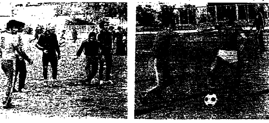
قطعة من تربية اللجنة ... وشهد من تدريب المتصار ( تصوير محمد حرماني )

تربية اللجنة ... وشهد من تدريب المتصار ( تصوير محمد حرماني )